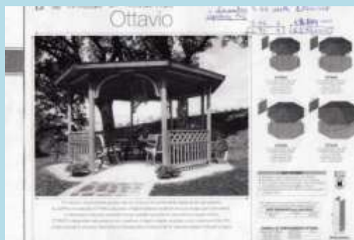
Esempio di gazebo

Dovrà essere costruito in un luogo appartato e tranquillo circondato dagli alberi sulla collina verso il Castello, così oltre a leggere ci si potrà divertire nei giardini intorno al gazebo giocando con gli amici. Avevamo pensato di sistemare nel gazebo una cassaforte con tanti libri a disposizione .... Poi abbiamo capito che sarebbe troppo complicato recuperare la chiave, inoltre chiunque potrebbe portare via i libri; i libri devono essere portati dalle persone interessate o dai gruppi di lettura. Modellini di libri famosi per ricordare che quel luogo si può usare solo per parlare e leggere verranno sistemati facendoli pendere dal soffitto. Un cartello su cui saranno scritte le regole del suo utilizzo verrà sistemato proprio all'ingresso del gazebo. Il nostro obiettivo sarebbe quello di riuscire a far leggere le persone con passione e interesse, anche le meno interessate.