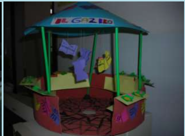
Il modellino: la preparazione