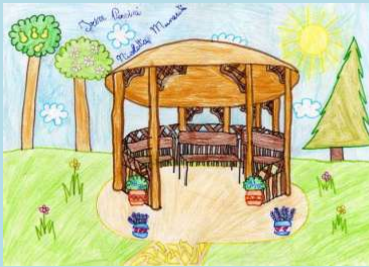
Il disegno del gazebo nella natura... per la lettura: il disegno